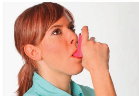
Quellen: Foto Kirchheim-Verlag; Zeichnungen ÄZQ